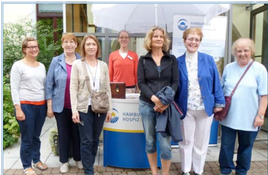
Teilnehmerinnen einer Trauergruppe

alle meine Gefühle richtig sind und sein dürfen. Trauer ist keine Krankheit, Trauer ist normal! Für mich war diese Erkenntnis wichtig.