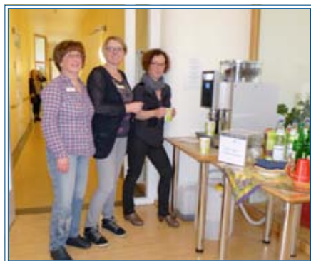
Andrang vor ‚Melitta‘

Kaffee – köstlich! Wir haben eine erfrischende und besonders fleißige neue Mitarbeiterin für das stationäre Hospiz gewonnen. Die Dame hört auf den Namen Melitta und erfüllt