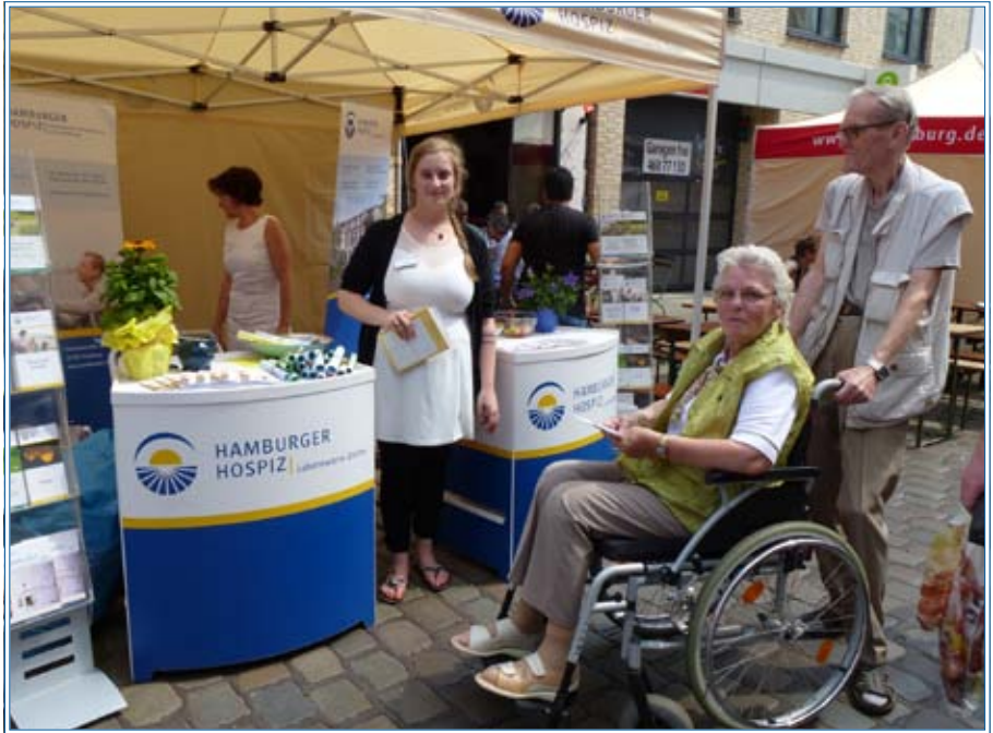
Frau B am Stand des Hamburger Hospiz auf der „altonale“

ihres Ehemannes hat sie sich, überraschend für ihn, früher aus dem Hospiz entlassen lassen.