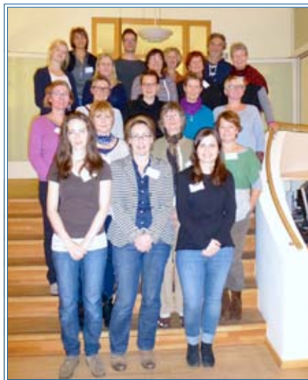
Ehrenamtliche ambulante HospizlerInnen

Vom November 2014 bis in den April 2015 fand die Schulung „ehrenamtliche ambulante Hospizarbeit“ statt. Interessierte wollten wissen, wie sie Sterbenden und Angehörigen achtsam beistehen können. Und sie wollten herausfinden, ob ein Ehrenamt in der Hospizarbeit in ihr Leben passt. In 100 spannenden Unterrichtseinheiten ergründete die Gruppe diese und andere Fragen.