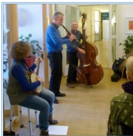
Jazz im Hospiz

11. Es macht mir Freude im Hamburger Hospiz e.V. mitzuwirken. (5,72)