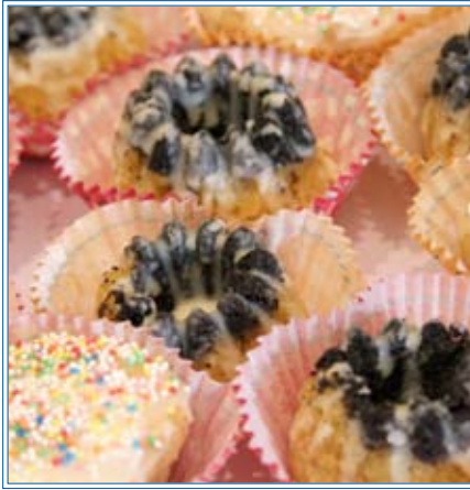
Leckereien beim Frühlingsempfang

und Freundinnen und Freunde des Hamburger Hospiz e.V..