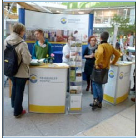
Infostand beim Welthospiztag

Orte anzubieten, wo Bürgerinnen und Bürger persönlich und doch geschützt über die bewegenden Themen der Endlichkeit sprechen können! Das war unser Anliegen am Welthospiztag, dem 10. Oktober, und am Tag der offenen Tür, am 11. Oktober. Über 30 haupt- und ehrenamtliche MitarbeiterInnen waren an diesen Tagen mit Interessierten im Gespräch und boten Vorträge und Führungen an. Eine feine Kaf-