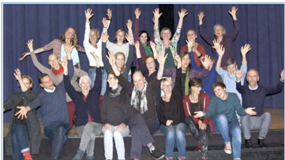
Teamtag im Herbst 2015