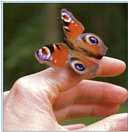
Trauer um ein verstorbenes Tier

Was Werte und Pflichten begründen, was gut und schlecht ist, ergibt allerdings aus der neutralen Perspektive der Naturwissenschaft keinen Unterschied. Es gibt also keine – außerhalb von uns Menschen bestehende – Instanz, die über gut und schlecht bestimmt. Wir bestimmen, was Bedeutung hat. Und dies meist danach, was zweckmäßig und was unzweckmäßig ist. (David Hume)“