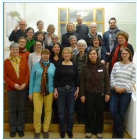
Neue ehrenamtliche KollegInnen

kurses dürfen sie nun im Hospiz aus-schwärmen. Die Einsatzorte sind vielfältig. Sie befinden sich beispielsweise in der Begleitung von Gästen, in der Öffentlichkeitsarbeit, am Empfang, in der Gestaltung von Festen und in der Hauswirtschaft. Wir freuen uns auf die Zusammenarbeit!