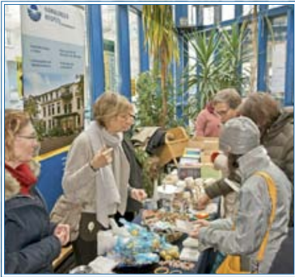
Flohmarkt in der FABRIK

Sehr herzlich danken wir den Veranstaltern für den guten Standplatz und die gute Betreuung! Auch danken wir den fleißigen Standhelfern und großzügigen Warenspendern sowie unserer kauffreudigen Kundenschaft!