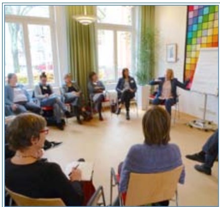
Wie bleibe ich in meiner Kraft

Kraftvoll: Wie bleibe ich in meiner Kraft? Diese wichtige Frage bewegte einen Samstag im November 30 ehrenamtliche HospizlerInnen im Hamburger Hospiz e.V. Neben einem köst-