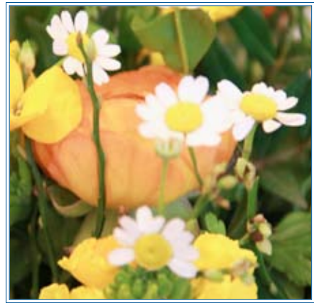
Zeichen des Dankes