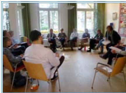
Fortbildung ehrenamtlicher Mitarbeiter

Anlässlich einer Mitarbeiterbefragung wurde es deutlich: Viele ehrenamtliche HospizlerInnen wünschen sich einen Seminartag zum