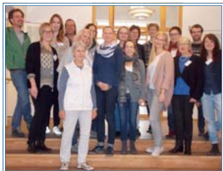
Neue ehrenamtliche Mitarbeiter

keiten kenne ich, Nähe und Distanz zu regulieren? Diese Reise währt bis Ende April. Wir wünschen gutes Gelingen und viel Freude im Ehrenamt!