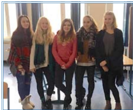
Schülerinnen der Max-Brauer-Schule

In einer Präsentation wollten wir unseren Mitschülern verschiedene Meinungen darstellen und benötigten dafür möglichst viele Eindrücke und Begründungen. Hospize, die Sterbende begleiten, schienen uns