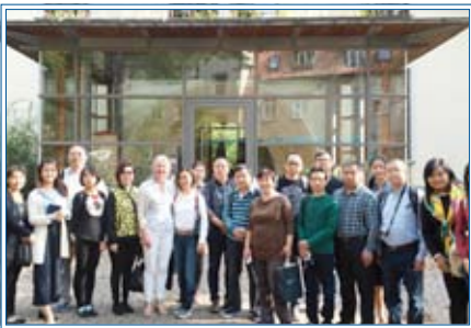
Besuch aus China

Für die Zukunft kann man das keinesfalls ausschließen. Im Herbst 2016 besuchte nämlich zum dritten Mal eine chinesische Delegation von Pflegekräften, Einrichtungsleitern und Investoren den Hamburger Hospiz e.V. und erkundete wissbegierig die Einrichtung und die Arbeit. Von besonderem Interesse war dabei die Gastfreundschaft mit der umfassenden Versorgung, die von den Hospizlerinnen und Hospizlern ausgeht. Den chinesischen Hospiz-Pionieren wünschen wir alles Gute und viel Erfolg!