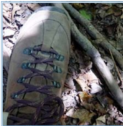
Trauer auf Reisen

Als ich 3 Tage vor Santiago glaubte, nichts geht mehr, über die letzten Hindernisse kommst du nicht mehr,