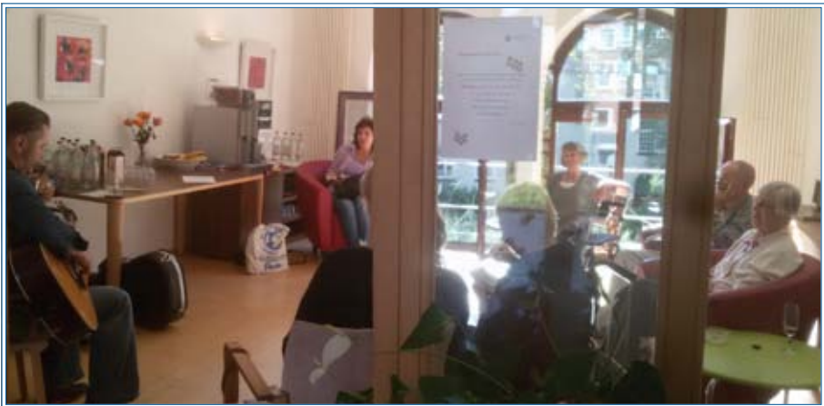
Musiker „Buddy“ beim Konzert

... so lautet die Schlagzeile für diese Meldung. Ins Wohnzimmer hinein bringt sie im September 2016 der Musiker „Buddy“ mit schöner, heller Stimme, Gitarre und Mundharmonika. Verstärkung bekommt er von Hospizgästen und Angehörigen. Diese eilen – angelockt von Elvis, Dylan und