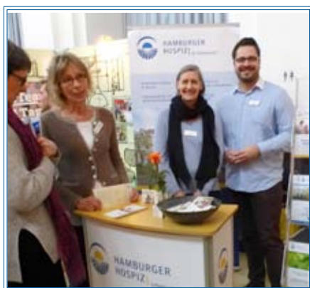
Infostand auf der aktivoli

Eigentlich waren die stationären haupt- und ehrenamtlichen Hospizlerinnen ausgezogen um Bürgerinnen und Bürger für ein Ehrenamt im Hamburger Hospiz e.V. zu begeistern. Doch auch auf der aktivoli, der Messe für das Ehrenamt, am 17.01.2017 in Hamburg zeigte sich, wie hoch das Bedürfnis nach allgemeiner Information und Austausch zum Themenbereich Sterben, Tod und Trauer in der Bevölkerung ist. Ehrenamtlich Interessierte fanden dennoch auch den Weg an den viel besuchten Infostand. Sie wollten sich insbesondere ein Bild davon machen, welche Erfahrungen auf HospizlerInnen zukommen und welche Unterstützung Ehrenamtliche erfahren. Die fleißigen BeraterInnen Met-