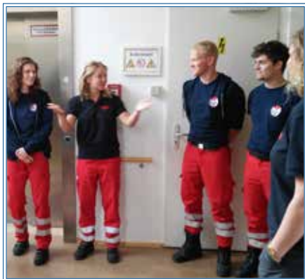
Besuch von der Feuerwehr

Ein abwechslungsreicher und vor allem schöner Tag also, der uns für die Hospizarbeit der nächsten Zeit stärkt. Und alle überlegen schon: Was machen wir am Teamtag 2018?