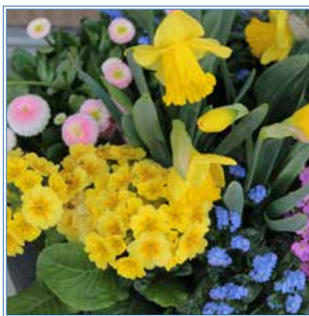
Blumen für den Balkon

Auf ihrem kleinen französischen Balkon hängen Blumenkästen. Die Blumen waren aber leider eher braunes Gestrüpp ohne Leben. Vom Bett