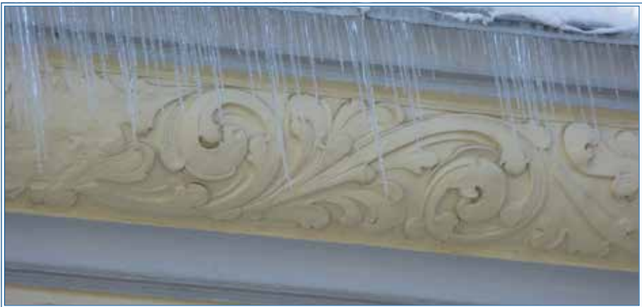
Eiszapfen im Winter

Es macht sich schlagartig bei allen sowohl Überraschung als auch ein klein wenig Erleichterung breit.