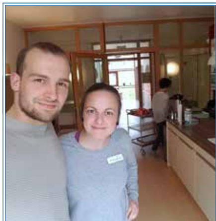
Eric Stehfest zu Besuch im Hospiz

Gute Zeiten, schlechte Zeiten? Für Eric Stehfest sind diese vier Worte beruflich wie auch biografisch von Bedeutung. 10 Jahre lebte der Schauspieler mit seiner Crystal Meth-Sucht, bevor er frei davon wurde. Nun hat er sein autobiografisches Buch „9 Tage wach“ veröffentlicht. Und wach im positiven Sinne bleibt er, nämlich für die Frage, in welcher Vielfalt die Zustände „still und wach“ zusammengehen. Für seinen gleichnamigen Dokumentarfilm kam er am 5. Mai 2017 ins Hamburger Hospiz. Hier sprach er mit Pflegekräften und Hospizgästen und fing bewegende Gespräche für seinen Film ein. Nun wünschen wir vor allem eins: Gute Zeiten! Ganz persönlich und für dieses spannende Projekt!