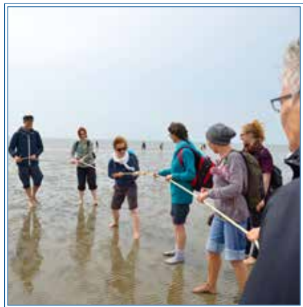
„Team-Work“ im Watt

Für ein wenig Abenteuerfeeling war auch gesorgt: auf der Hinfahrt wurde unser Bus einer gestrengen Polizeikontrolle unterzogen, und auf